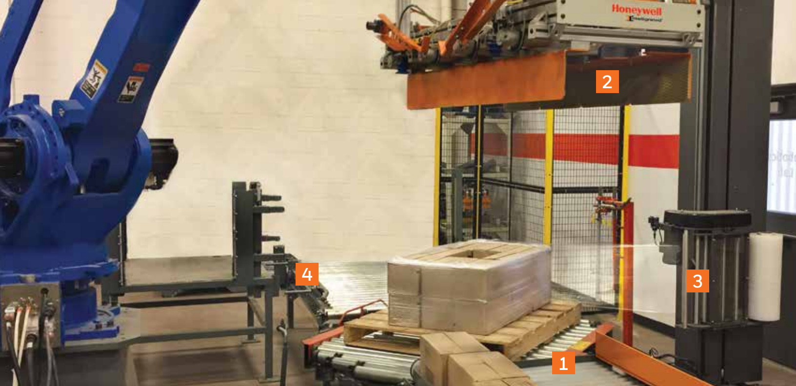
1. Esteira de alimentação e formação de cargas 2. Ferramentas robotizadas Alvey 3. Empacotamento a vácuo 4. Gerenciamento de folhas e paletes