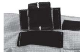
Solapa del túnel

Paso 5. Pliegue la presilla de mano que sobresale a través de la abertura del túnel hacia abajo de manera que haga contacto firme con la cinta de velcro cosida en la espalda de la chaqueta. Luego, doble la solapa del túnel hacia abajo y presiónela firmemente para que quede en su lugar.