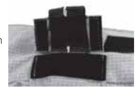
Rabat du tube

Étape 5 – Passez le coulisseau saillant à travers l'ouverture du tube pour qu'il fasse bon contact avec la bande couverte de boucles cousue à l'arrière du manteau. Pliez ensuite le rabat du tube et appuyez fermement pour le tenir en place.